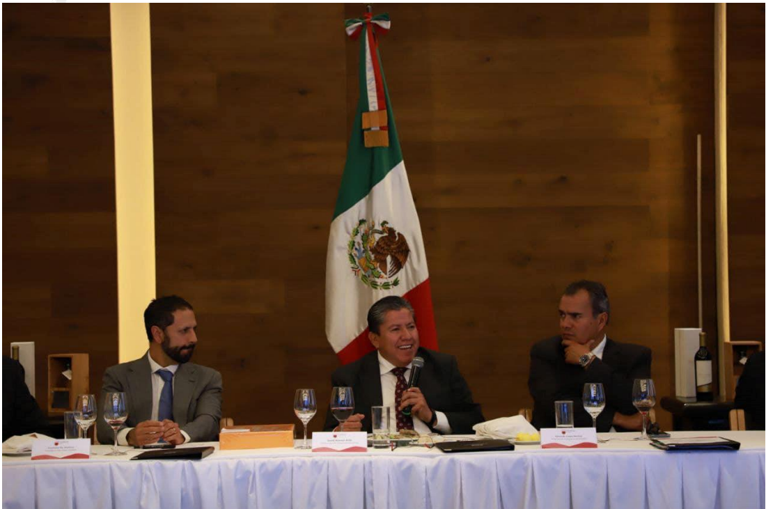
Cumbre de Empresas por la Transformación de Zacatecas